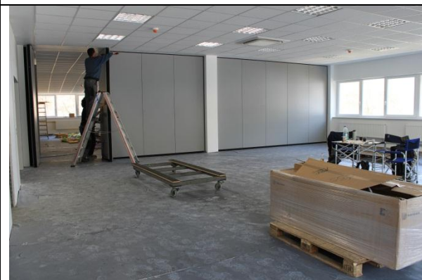
Dachgeschoss/Einbau Trennwand 29.03.2012