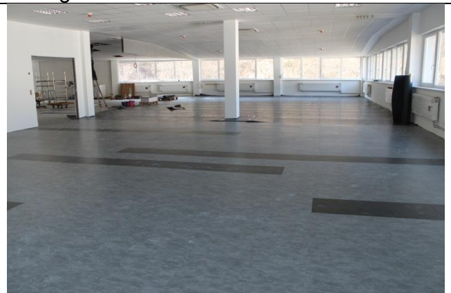
Dachgeschoss/Aufenthaltsraum mit angrenzendem Showroom und Konferenzbereich