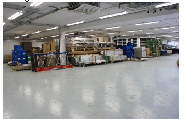
Einrichtung Mechanik 29.03.2012