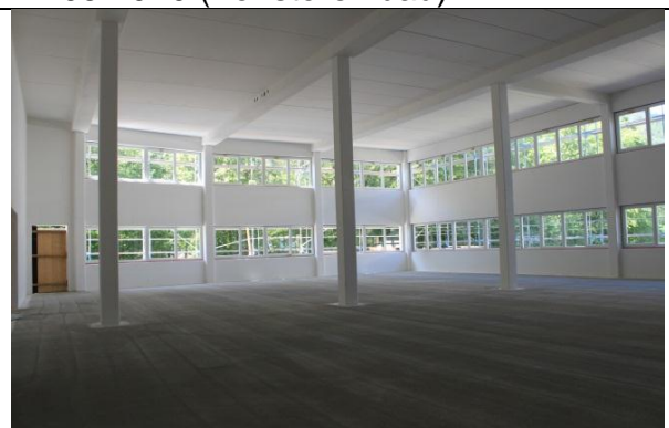
23.05.2011 (künftiges Lager)