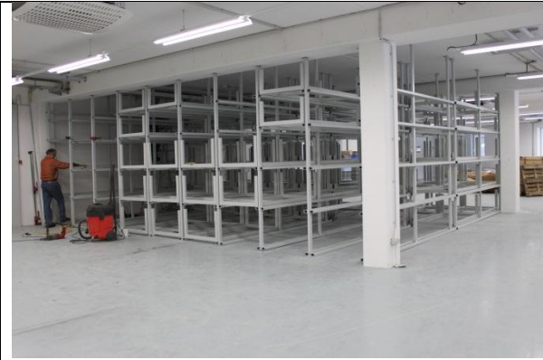
Einbau Profillager Mechanik 9.2.2012