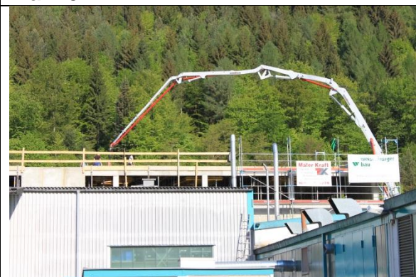
05.05.2011 (Dach wird betoniert)